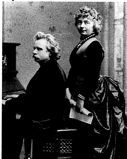
Edvard Grieg sammen med Nina foran pianoet i 1888.

Orkestermusikk. Blant de av Griegs verker som har vært med på å grunnfeste hans verdensberømmelse, er det to som har spesiell betydning. Det ene er musikken til Ibsens drama Peer Gynt , der særlig de to orkestersuitene har gått sin seiersgang verden over. Musikken viser Griegs betydelige evner som scenemusikalsk dramatiker. Det andre er klaverkonserten i a-moll. Både Peer Gynt -musikken og A-mollkonserten viser at Grieg som orkesterkomponist hadde betydelige evner. Virkemidlene er balanserte, klangen rik og effektiv. Et annet verk som viser det samme, er Fra Holbergs tid (gjerne kalt Holbergsuiten) for strykeorkester, et verk det er blitt henvist til som et forbilde når det gjelder å skrive for strykeorkester.